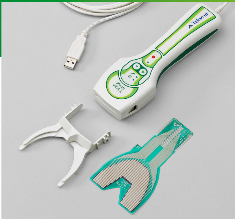
センサインジケター

これより、科学的で客観的なデータに基づいた咬合診断、治療結果の判定が可能となります。